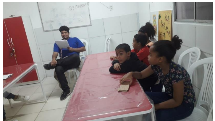
Comemoração das festividades Juninas – Evento coletivo dos grupos de 7 a 12 e 13 a 17